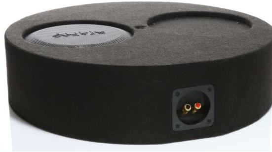
SUBFRAME R10 FLAT EVO3-D4